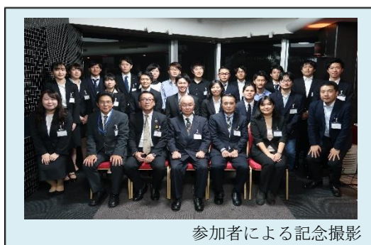
参加者による記念撮影