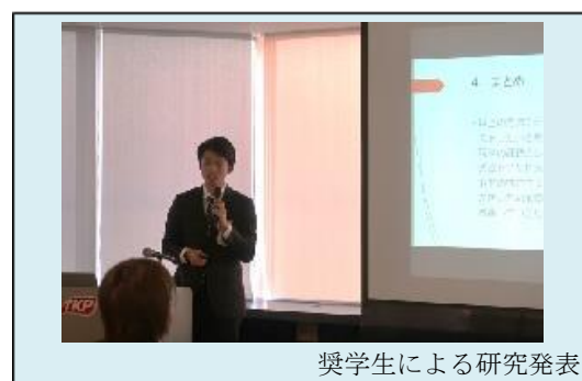
奨学生による研究発表